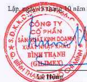
Chu tịch HĐQT